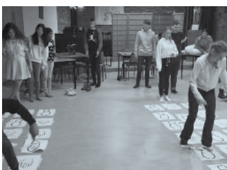
Behendigheidsspel bij Youth0251.

Op 30 oktober was er weer een Youth0251 bijeenkomst voor tieners en jongeren. We hebben samen gegeten en het gehad over hoe God naar ons kijkt. Hij kijkt niet naar ons uiterlijk, maar naar hoe wij van binnen zijn.