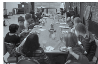
Gezellige start met de vormelingen van 2023

Zit jij in groep 8 van de basisschool of in de brugklas en heb je de uitnodiging voor dit avontuur gemist? Meld je dan