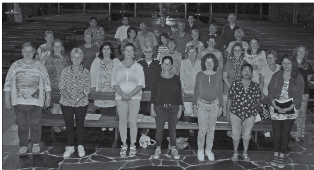
Koor Intermezzo tijdens een recente repetitie.