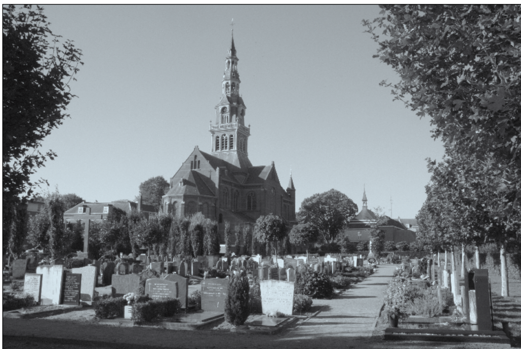
Het Laurentiuskerkhof: een schitterende laatste rustplaats.