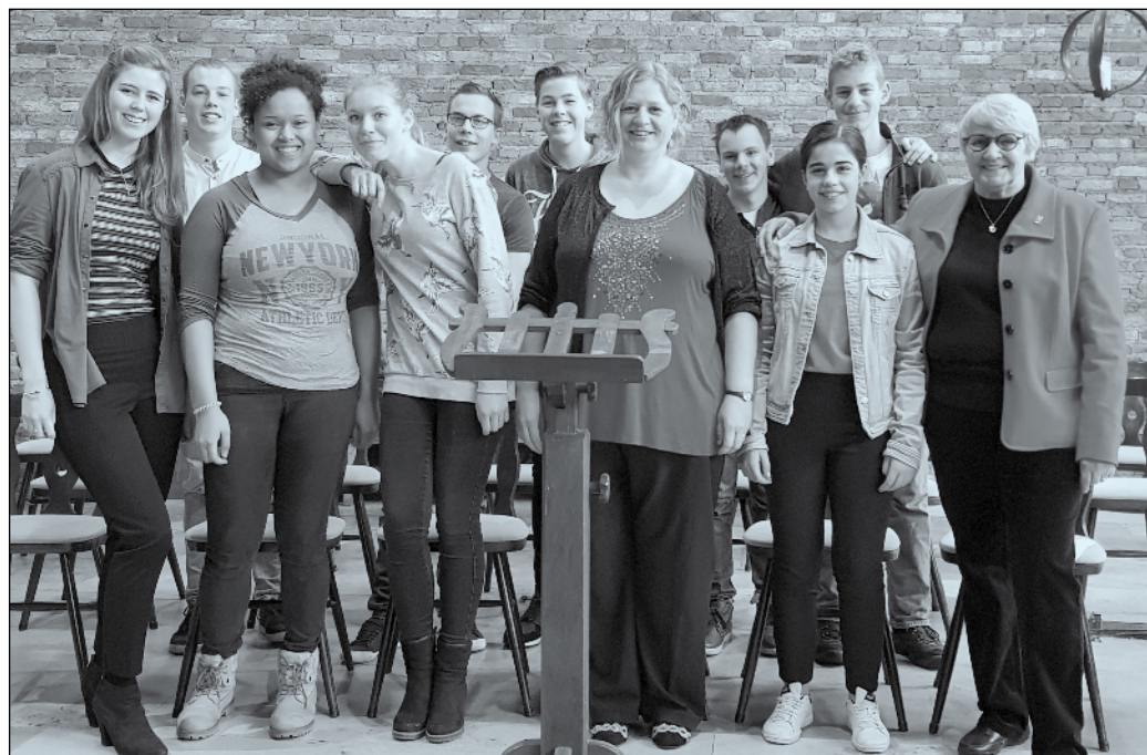
De enthousiaste leden van de JKH.